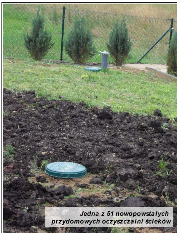
Jedna z 51 nowopowstałych przydomowych oczyszczalni ścieków