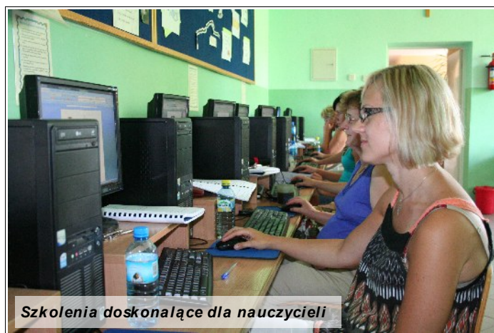
Szkolenia doskonalące dla nauczycieli

Szybкими krokami zbliża się nowy rok szkolny 2010/2011. Szczególnej troski jak zawsze wymagają placówki szkolne, w których trwają intensywne prace remontowe. Gmina Kartuzy doceniając przede wszystkim rolę nauczyciela w wypracowywaniu odpowiedniego poziomu edukacji zaproponowała naszym pedagogom oraz pracownikom szkół realizację projektu p.n. „Jakość oświaty w naszej gminie. Kursy doskonalące dla nauczycieli, pracowników administracji oświatowej i kadry zarządzającej oświatą w gminie Kartuzy”. Celem projektu który dofinansował Urząd Marszałkowski Województwa Pomorskiego w ramach Programu Operacyjnego Kapitał Ludzki, jest podniesienie kwalifikacji co najmniej 137