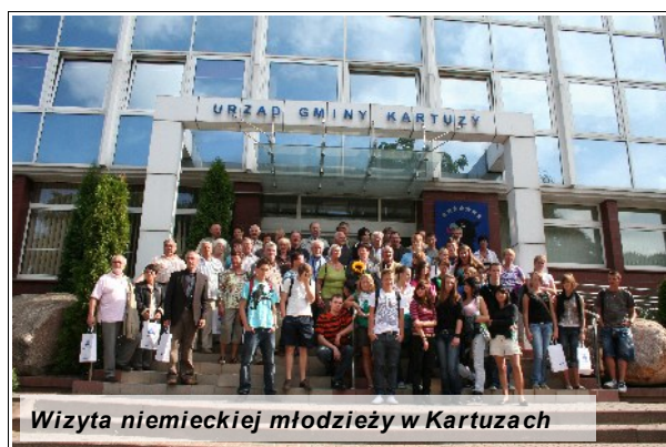
Wizyta niemieckiej młodzieży w Kartuzach

Symbolem dobrze rozwijającego się partnerstwa jest posadzony przy Muzeum Kaszubskim dąb oraz pomnik upamiętniający przyjęcie Polski do Unii Europejskiej, a ufundowany przez Koło Przyjaźni Niemiecko – Polskiej i mieszkańców Duderstadt, a także pamiątkowa tablica przy informacji turystycznej z okazji 5 lecia partnerstwa i kierunkowskaz wskazujący odległość z Kartuz do Duderstadt.