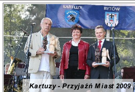
Kartuszy - Przyjaźń Miast 2009