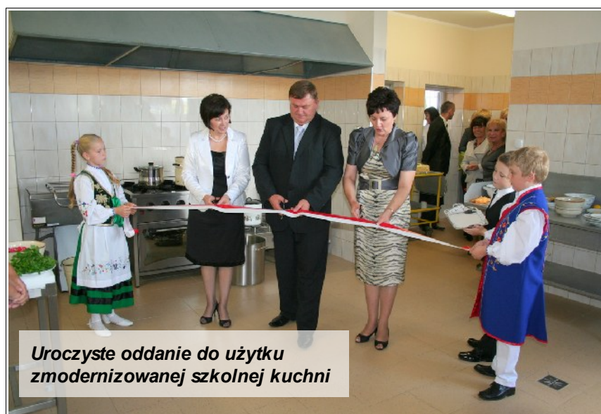
Uroczyste oddanie do użytku zmodernizowanej szkolnej kuchni