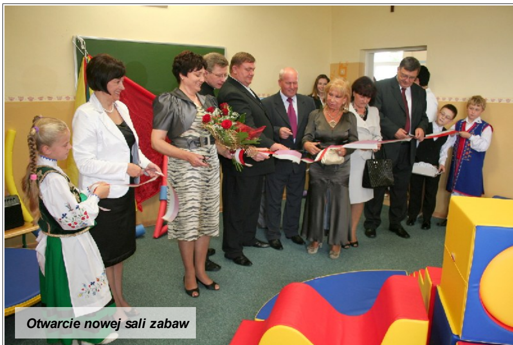
Otwarcie nowej sali zabaw

W odczuciu wielu uczniów czas wakacji upływa zbyt szybko. Jak co roku jednak 1 września jedni z nieśmiałością, a inni z obawą, a jeszcze inni z radością przekraczają próg swojej szkoły by rozpocząć nowy rok szkolny. Gminna inauguracja nowego roku szkolnego 2010/2011 miała miejsce w Kielpinie. Kielpino to największe sołectwo Gminy Kartuszy liczące ponad 3.000 mieszkańców, mające duży potencjał 11rozwojowy. Dzięki licznym terenom inwe-