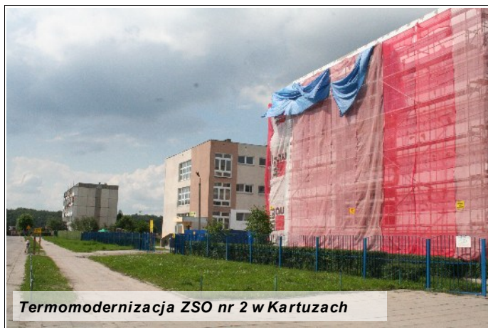
Termomodernizacja ZSO nr 2 w Kartuzach

Pod koniec lipca Gmina Kartuzy rozpoczęła kolejną inwestycję, której zadaniem jest nie tylko poprawa warunków realizacji procesu kształcenia ale też obniżenie kosztów eksploatacji budynków szkolnych. W ramach partnerskiego projektu p.n. "Termomodernizacja budynków oświatowych na terenie powiatu kartuskiego" modernizujemy Zespół Szkół Ogólnokształcących nr 2 na os. Wybickiego w Kartuzach. Ten prawie 30-letni obiekt jest naszą największą tego typu placówką. W 6 segmentach kształcą się uczniowie Szkoły Podstawowej Nr 5, Gimnazjum Nr 2 oraz Liceum Ogólnokształcącego Nr 2. Działa tutaj również Akademia Przedszkolaka. Obiekt nie gwarantował odpowiednio wysokiego poziomu izolacji termicznej, dlatego Burmistrz Gminy Mirosława Lehman podjęła decyzję o wykonaniu termomodernizacji szkoły. Wśród prac, które zostaną zrealizowane wymienić należy: ocieplenie ścian nadziemna budynku oraz ścian fundamentowych styropianem wodoodpornym, położenie tynków, ocieplenie stropodachu wentylowanego części dydaktycznej budynku, ocieplenie stropodachu sali gimnastycznej z zapleczem, wykonanie nowego pokrycia dachowego, wymiana istniejących okien na nowe PCV, modernizację instalacji centralnego ogrzewania i węzła ciepłego oraz wymianę drzwi zewnętrznych. Zakończenie inwestycji planowane jest pod koniec października br. Koszt projektu to prawie 2,8 mln zł.