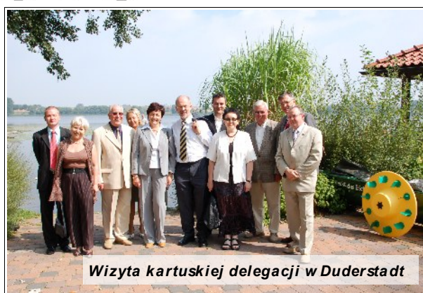
Wizyta kartuskiej delegacji w Duderstadt