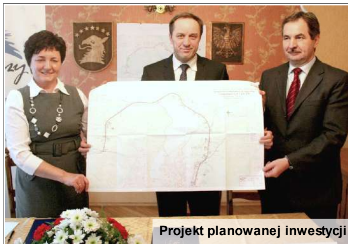
Projekt planowanej inwestycji