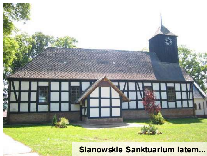
Sianowskie Sanktuarium latem...