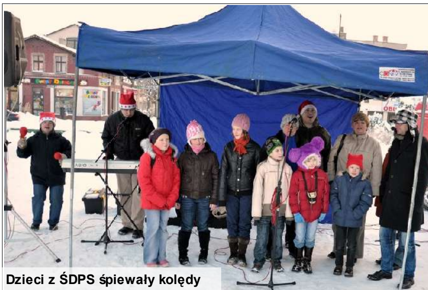
Dzieci z ŚDPS śpiewały kolędy

16 grudnia na kartuskim Rynku miał miejsce kiermasz świąteczny zorganizowany Środowiskowy Dom Samopomocy w Kartuzach. Tradycyjnie podczas kiermaszu na kartuskim Rynku można było kupić ozdoby świąteczne wykonane przez podopiecznych Środowiskowych Domów Społecznych z terenu powiatu kartuskiego i posłuchać kolęd w wykonaniu zespołu Sunday. Atrakcją kiermaszu była możliwość przejażdżki saniami