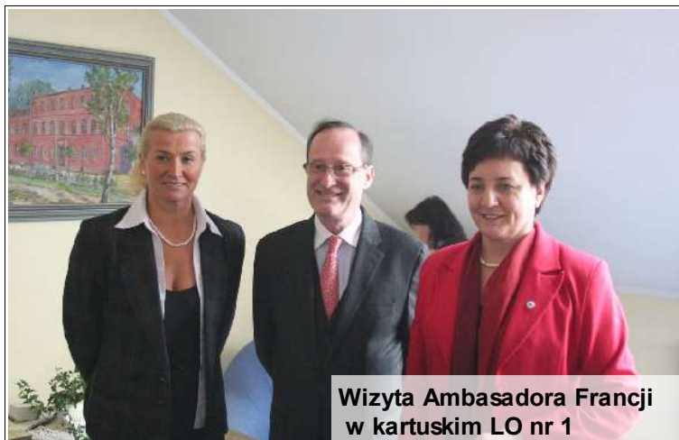
Wizyta Ambasadora Francji w kartuskim LO nr 1