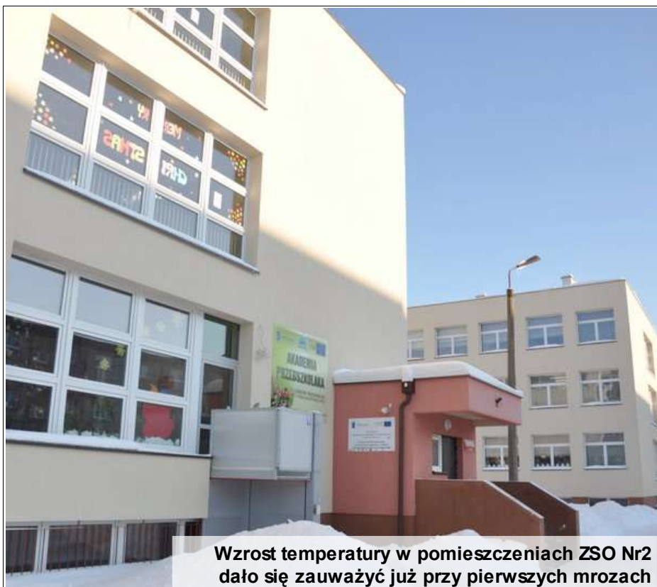
Wzrost temperatury w pomieszczeniach ZSO Nr 2 dało się zauważyć już przy pierwszych mrozach

Do 12 listopada 2010 trwała termomodernizacja budynku Zespołu Szkół Ogólnokształcących Nr 2 w Kartuzach. Ponad dwudziestoletni budynek wymagał ocieplenia ścian, przebudowy instalacji centralnego ogrzewania i węzła ciepłego, wykonania nowego pokrycia dachowego, wymiany okien. Skutki wykonanej termomodernizacji w postaci wzrostu temperatury w pomieszczeniach dydaktycznych dało się zauważyć już przy pierwszych mrozach. Przedmiot zamówienia realizowany był w ramach Regionalnego Programu Operacyjnego dla Województwa Pomorskiego na lata 2007-2013 w partnerstwie ze Starostwem Powiatowym w Kartuzach, które było liderem projektu.