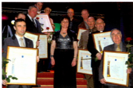
Fot. Archiwum UG - Człowiek Roku 2009

Serdecznie zapraszamy wszystkich mieszkańców.