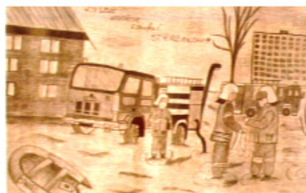
Marcelina Piepiórka z Kiełpina Grupa III (wiek 13-16 lat)