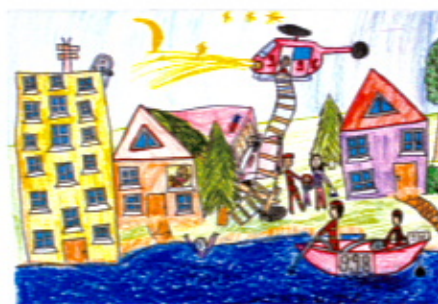
Zuzanna Hinc z Dzierżązna Grupa I (wiek 6-8 lat)