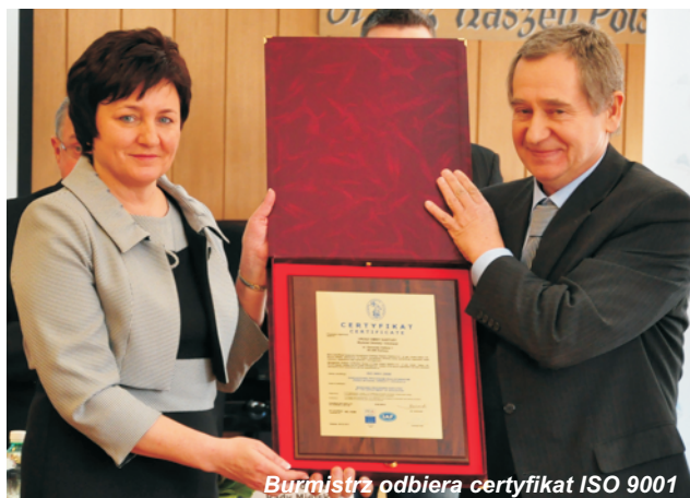
Burmistrz odbiera certyfikat ISO 9001

✓ Wydział Oświaty i Edukacji Urzędu Miejskiego w Kartuzach otrzymał certyfikat ISO 9001. System zarządzania jakością ISO 9001:2008 obejmuje zarządzanie procesami realizowanymi przez Wydział.