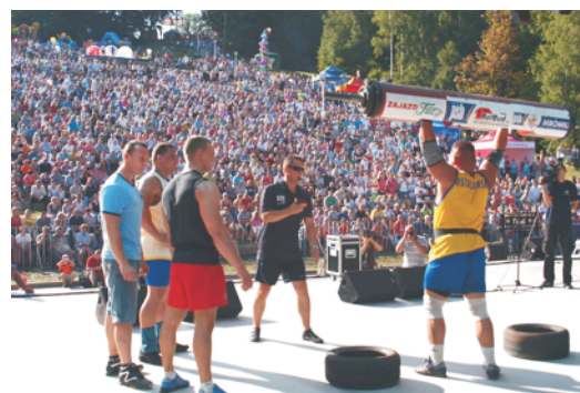
Zawody Strongman na Złotej Górze