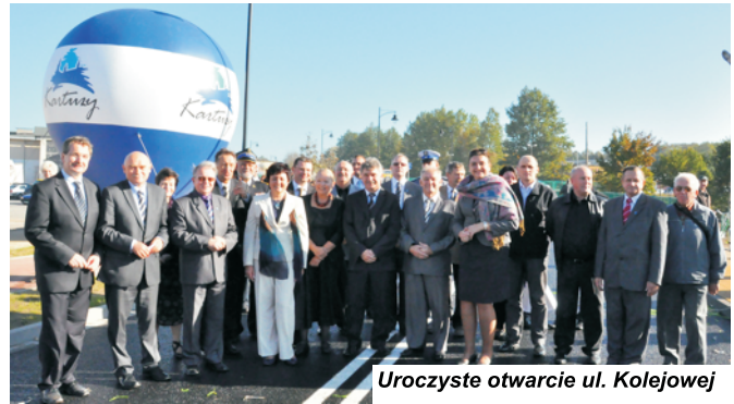
Uroczyste otwarcie ul. Kolejowej