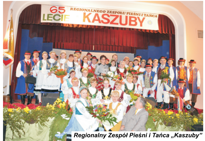
Regionalny Zespół Pieśni i Tańca „Kaszuby”