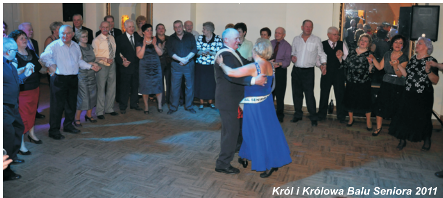
Król i Królowa Balu Seniora 2011