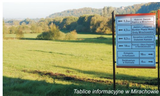
Tablice informacyjne w Mirachowie

✓ 30 rodzin z gminy Kartuzy otrzymało zestaw komputerowe w ramach projektu „Gmina Kartuzy- myślimy globalnie, działamy lokalnie”. W ramach projektu jednostki samorządu podległe Gminie m.in. takie jak: szkoły, świetlice zostały wyposażone w sprzęt komputerowy w wielkości 270 szt.