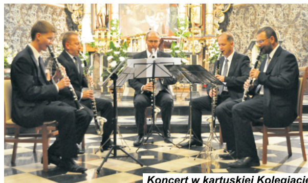
Koncert w kartuskiej Kolegiacie