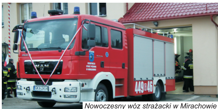
Nowoczesny wóz strażacki w Mirachowie