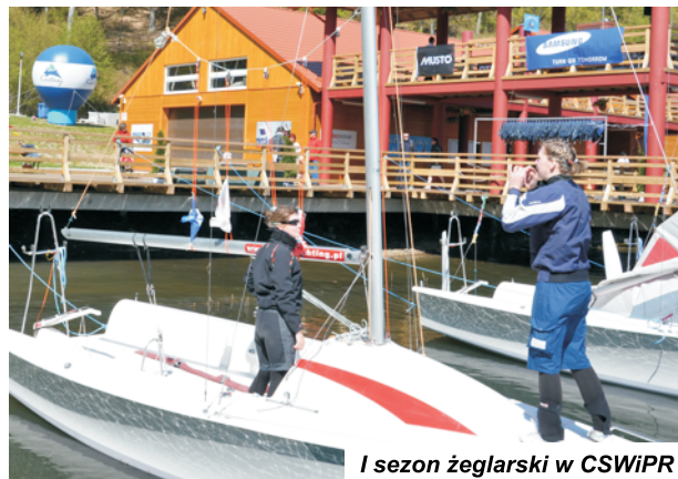
I sezon żeglarski w CSWiPR