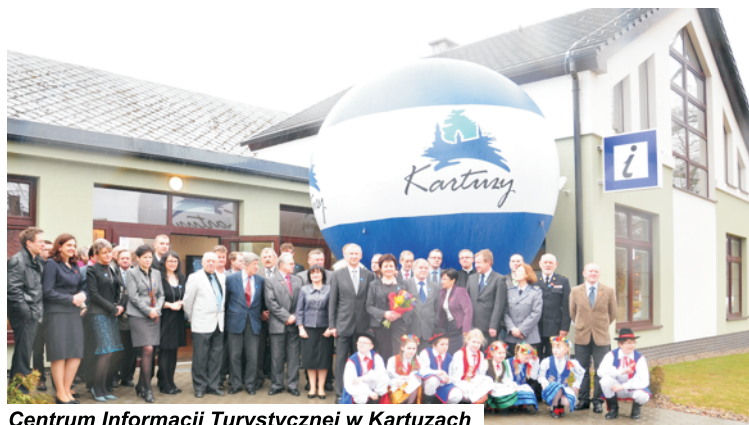
Centrum Informacji Turystycznej w Kartuzach

✓ 30 kwietnia zorganizowano na kartuskim Rynku spotkanie pod nazwą „Szczęśliwy Dzień” z okazji beatyfikacji Ojca Świętego Jana Pawła II. Modlitwne czuwanie zorganizowane zostało przy współpracy Urzędu Miejskiego w Kartuzach, 3 kartuskich parafii, Państwowej Szkoły Muzycznej I stp. Gimnazjum i Liceum Katolickiego im. Jana Pawła II, Telewizji Teletronik.