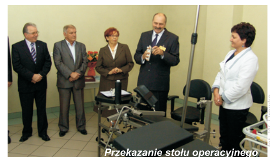
Przekazanie stołu operacyjnego