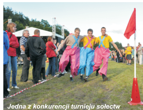
Jedna z konkurencji turnieju sołectw