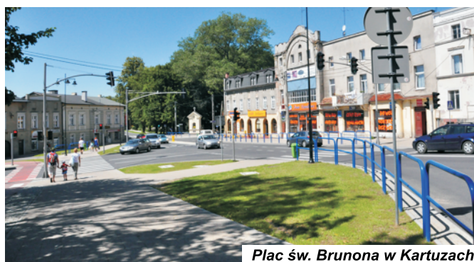
Plac św. Brunona w Kartuzach

✓ Otwarto Centrum Informacji Turystycznej w Kartuzach na ul. Klasztornej, które powstało w ramach projektu „Bramy Kaszubskiego Pierścienia”. Nowy budynek informacji w sposób znaczący przyczynił się do poprawy jakości obsługi turystów odwiedzających Stolicę Kaszub.