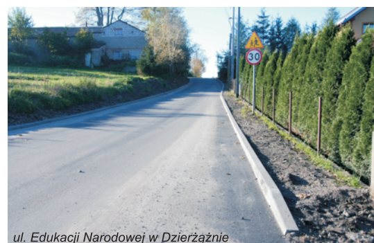
ul. Edukacji Narodowej w Dzierżążnie