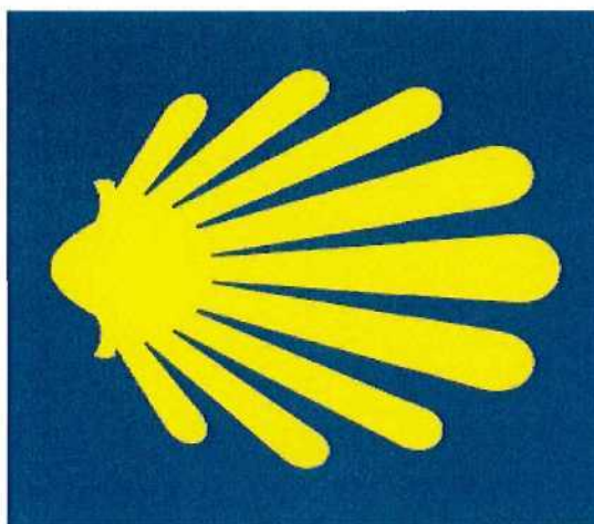
Pomeranian Way of St. James Re-vitalisation of the European Culture Route in the South Baltic Area